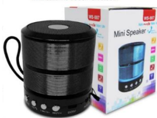
Mini Caixa de Som Bluetooth