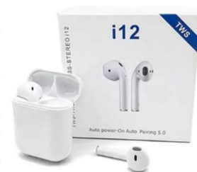
Fone de Ouvido Bluetooth i12 sem Fio Touch Recarregável